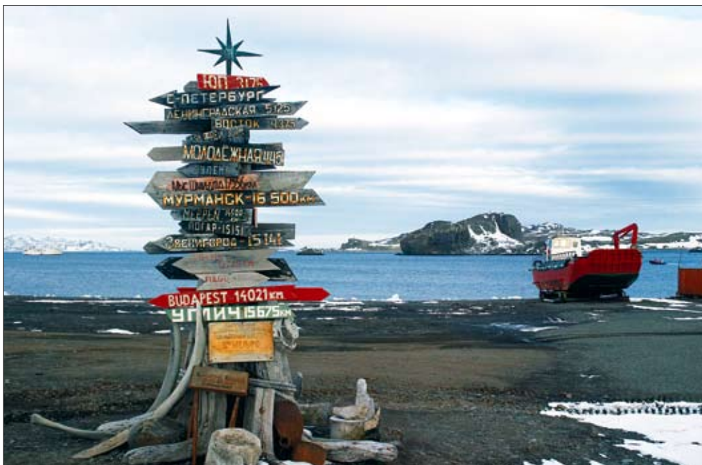
Z Antarktídy je domů vždycky daleko.

vztahy mezi Británií a jihoamerickými republikami hrozily přerůst ve válečný konflikt (nejžhavější byla situace v r. 1947) a všechny armády podnikaly v polárních oblastech „taktická cvičení“. Další mocnosti, včetně USA, se ovšem nedaly zahanbit – poslední expedice admirála Byrda, jíž se účastnily 4000 vojáků, také nebyla jen vědeckou. V 50. letech, pro nás spíše temných, se v Antarktídě naopak začalo „blýskat na lepší časy“. Z iniciativy WMO (Světové meteorologické organizace) se v letech 1957–58 konal Mezinárodní geofyzikální rok, v jehož rámci báдали v Antarktídě vědci z více než šesti desítek zemí. Dvanáct nejvýznamnějších (Argentina, Austrálie, Belgie, Chile, Jihoafrická unie, Francie, Japonsko, Norsko, Nový Zéland, USA, Sovětský svaz a Velká Británie)