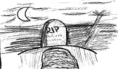
Protože zaviníte-li to, že se vaše skupina bude muset zkoušet, jste MRTVÍ