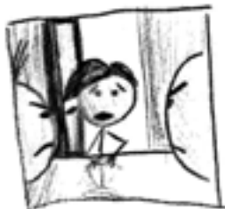
Největší chyba při skupinovém zkoušení...